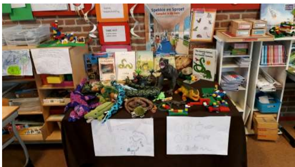
Project reptielen groep 3-4-5